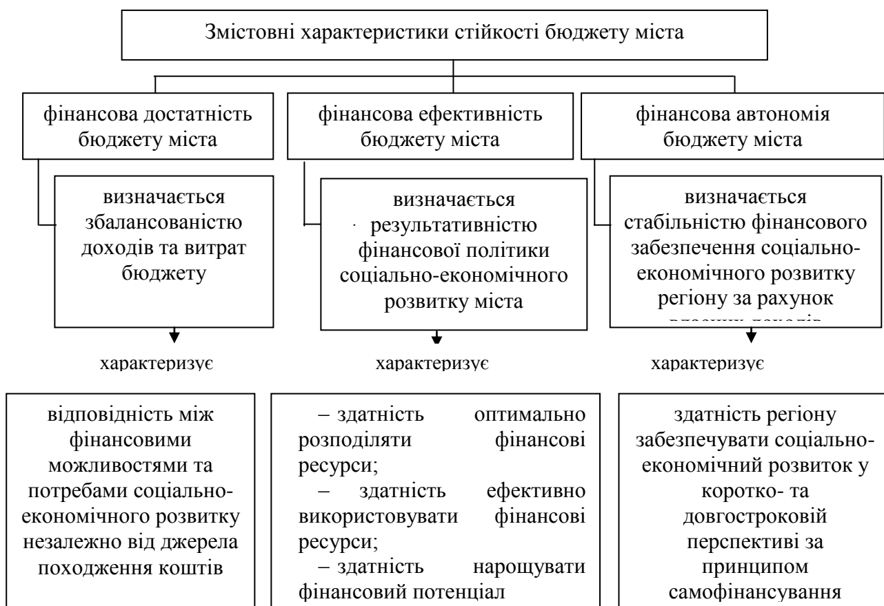
Рис. 2. Характеристики стійкості бюджету міста

Визначені концептуальні положення та підходи дозволяють виділити такі змістові характеристики бюджетної стійкості міста (рис.2).