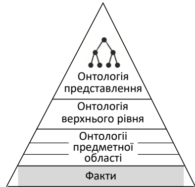
Рисунок 1 – Пірамідальна структура онтологій бази знань

7) < PERSONNEL> (#PS) – кадрового забезпечення, що складається з класів: керівний склад (#PSM), персонал підрозділів (#PSD), персонал